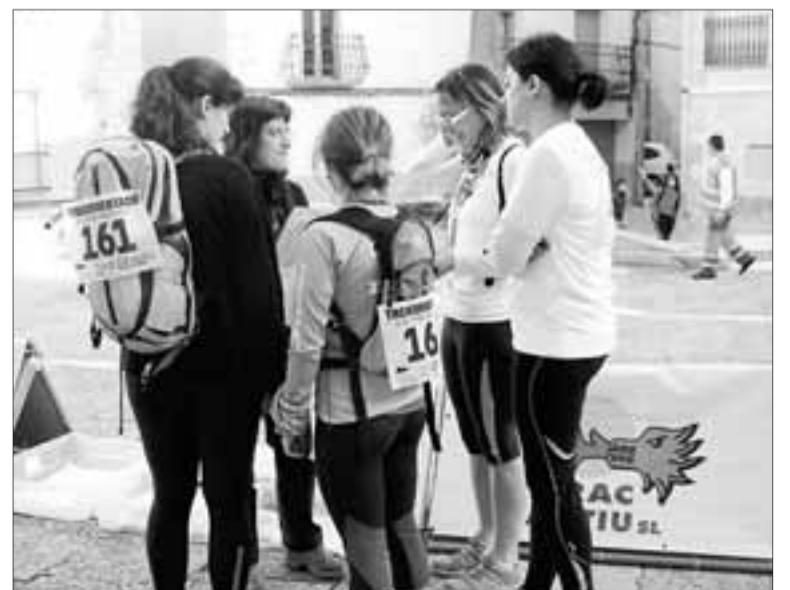
► La primera prueba se celebró en Vallbona de les Monges el pasado día 2 de marzo.

A día de hoy ya se han hecho más de 300 inscripciones para la caminata de Poblet y otros 100 inscritos ya se apuntaron desde el principio para participar en las tres pruebas.